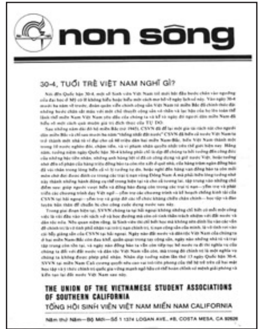
Bìa số 1 tạp chí Non Sông năm 1988