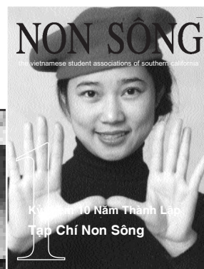
Non Sông số Kỷ Niệm 10 Năm và những số gần đây