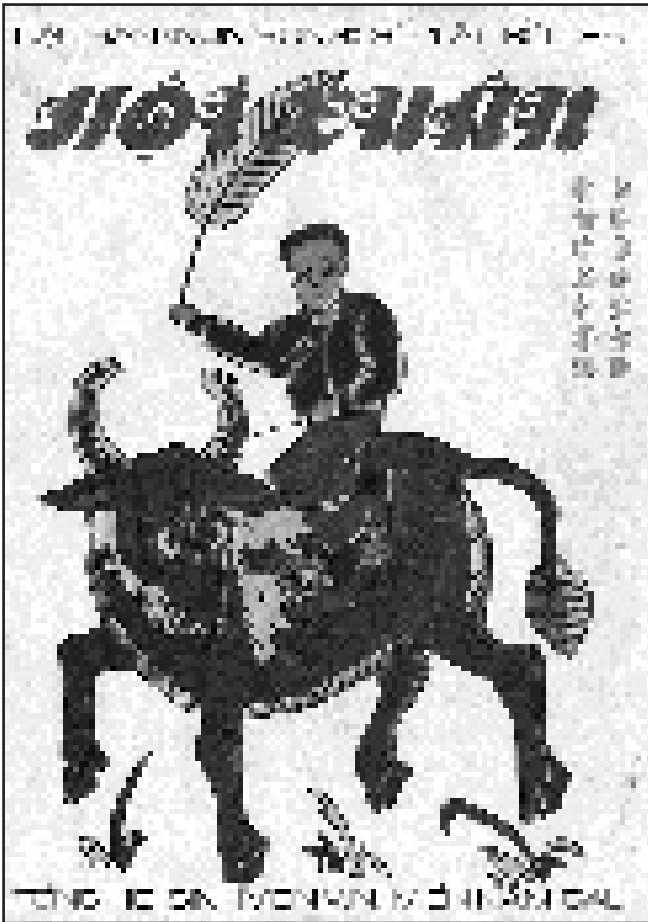
Bìa Độc San Xuân đầu tiên năm 1985