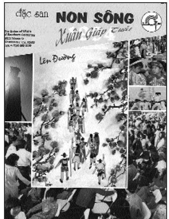
Số đầu tiên với chủ nhiệm Trịnh Trọng

Sau những tuần lễ học hỏi, các thành viên trẻ đã được biết nhiều về THSV và ý nghĩa của tờ Non Sông. Ai cũng rất thương mến những ý nghĩa mà tờ Non Sông đang đem đến cho giới trẻ. Không một ai muốn nhìn thấy tờ Non Sông phải đi vào dĩ vãng. Mọi người đều nhìn thấy là mình nên đoàn kết