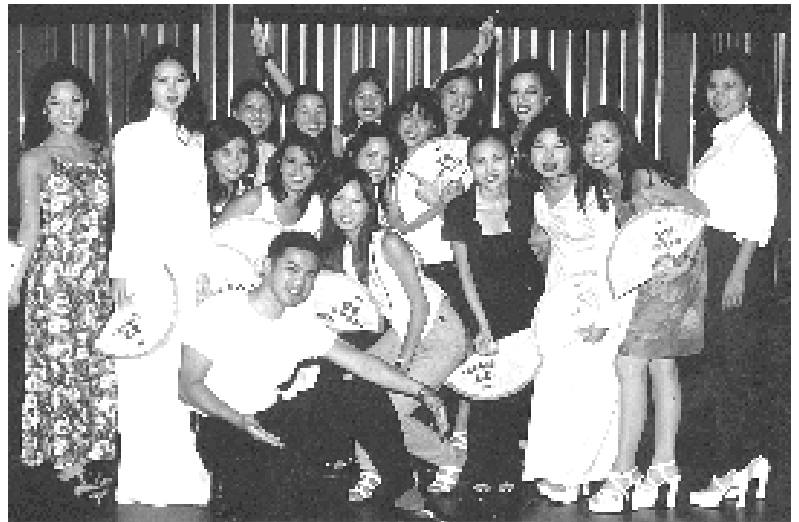
Thí sinh Hoa Hậu sau hậu trường

Hoa Hậu Áo Dài Long Beach năm nay sẽ nhận được giải thưởng gồm hiện kim và tặng phẩm là $5,000, Á Hậu I là $2,500, Á Hậu II là $1,500, Duyên Dáng $1,000, Thân Thiện $1,000, Tiếng Việt Lưu Loát $1,000, Sinh Hoạt Cộng Đồng $1,000. Ngoài ra số tiền lời sau cuộc thi sẽ được tặng cho Giải Khuyến Học.