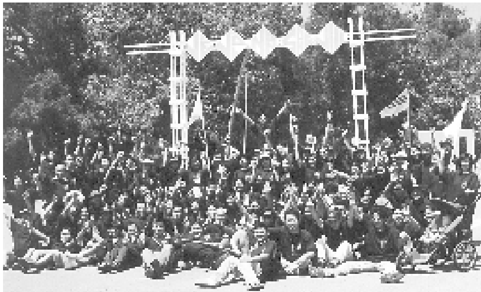
Chụp hình lưu niệm trước giờ nghỉ trại

8:45 am — Mọi người tập trung theo đội của mình để phân công các thành viên tham gia các trò chơi vận động như: Chạy tiếp sức, cứu thương, ném bong bóng nước... Các đường đua được bố trí sẵn các trọng tài biên trong BTC. Hai bên đường trại, mọi người theo dõi, cổ vũ các lực sĩ đội mình khá ồn ào. Nhiều “nhiếp ảnh gia” nghiệp dư trực sẵn ở điểm đích nhằm ghi lại những hình ảnh đẹp, rõ nhất của những kẻ chiến thắng. Các trò chơi vận động này vẫn hào hứng,