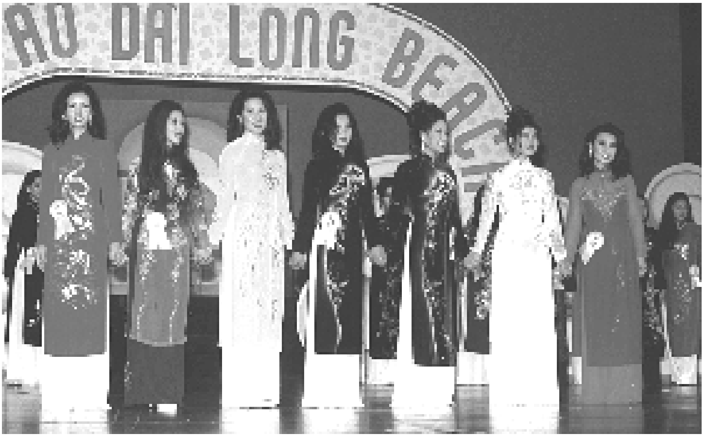
Các thí sinh vào vòng chung kết

lượn quần chúng thời ấy. Năm 1934, họa sĩ Nguyễn Cát Tường đã kích động phong trào cải cách: “...Các nhà đạo đức thường nói: Quần áo chỉ là những vật dụng để che thân thể ta khỏi gió mưa, nắng lạnh, ta chẳng nên để ý đến cái đẹp, cái sang của nó làm gì... Theo ý tôi, quần áo tuy dùng để che thân thể, song nó có thể là tấm gương phản chiếu ra ngoài cái trình độ trí thức của một nước. Muốn biết nước nào có tiến bộ, có mỹ thuật hay không, cứ xem y phục của người nước họ, ta cũng đủ hiểu...” Trong thập niên 1930, Cát Tường đưa ra thị trường kiểu áo dài mới Le mur. Kiểu Le mur được vẽ theo kiểu áo đầm Tây Phương với nối vai và tay phồng, cổ lá xen, cài khuy trên vai, mặc với quần trắng, đeo bóp, che dù, v.v... Sau đó, họa sĩ Lê Phổ cải tiến áo Le mur và mẫu áo dài này đã được hoan nghênh trong Hội Chợ Nữ Công Đà Nẵng. Đây là một kết hợp giữa áo Le mur và áo tứ thân, rất gần với chiếc áo dài tân thời ngày nay: nối vai và tay không phồng lên, cổ kín, cài nút bên phải, thân ôm sát người, hai