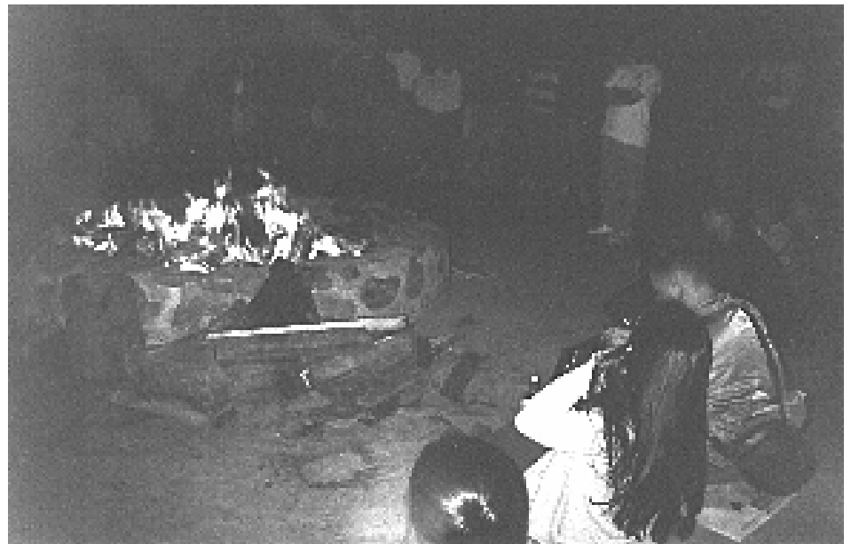
Đêm Huyền Sử...

Chúng tôi đã tưởng tượng không sai, tất cả các tiết mục, hoạt cảnh của các nhóm đều đặc sắc, mang ý nghĩa giáo dục về truyền thống hào hùng chống quân xâm lăng, tinh thần tự lập... được diễn bằng những động tác, lời thoại dí dỏm, hài hước, chọc cười lẫn cười bỏ cho mọi người. BTC cũng tham gia một tiết mục kịch tự biên tại chỗ “Kỷ niệm trại hè” khá đặc sắc với sự nhập vai của các