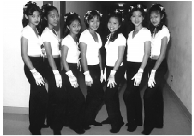
Các vũ công nhí từ trung tâm Việt Ngữ Vinh Sơn Liêm