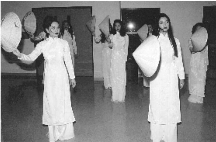
Diễn tập cho tiết mục mở đầu

Những thành viên trong ban giám khảo đã được mời dựa trên những tiêu chuẩn như: những người có uy tín, từng có nhiều đóng góp cho những sinh hoạt văn hóa, xã hội và nhân đạo trong cộng đồng người Việt. Một số là ân nhân và