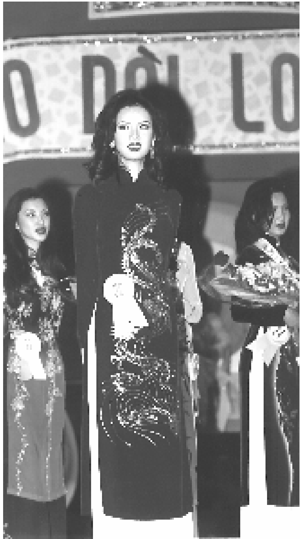
Á Hậu Áo Dài Long Beach 97

Sau khi chính phủ Pháp mở trường Cao Đẳng Mỹ Thuật Hà Nội, một lối cải cách cho chiếc áo dài truyền thống đã được một số người có tâm huyết với chiếc áo dài đưa ra. Các màu nâu, đen thông thường được thay bằng các sắc màu tươi sáng hơn, gây sôi nổi trong dư