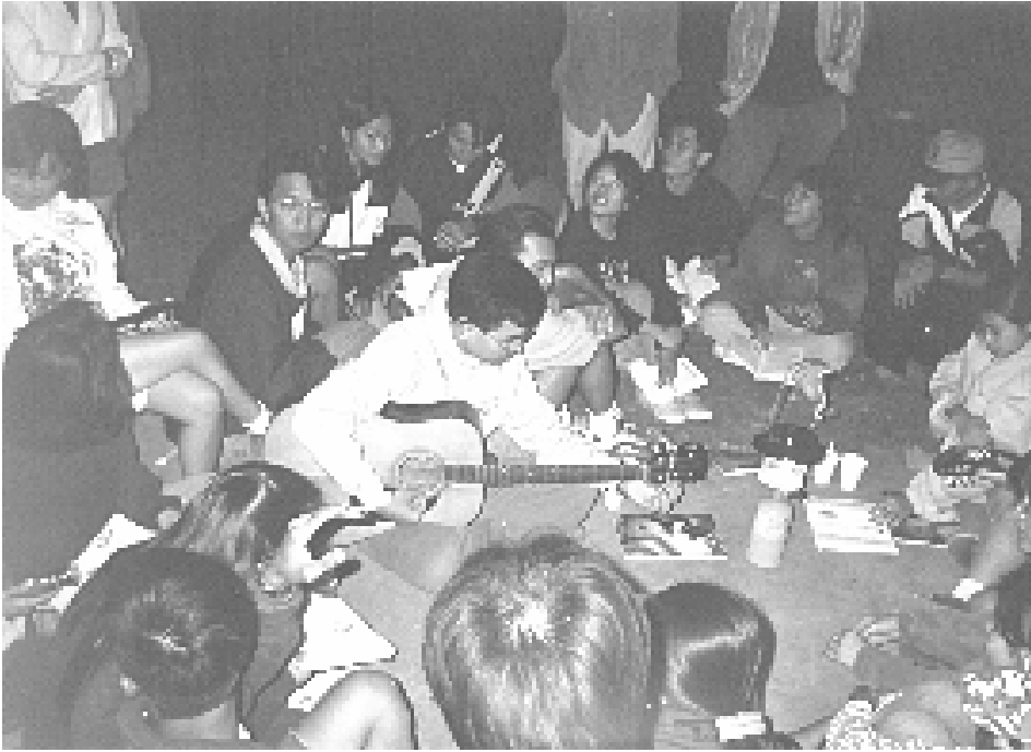
Văn nghệ "bỏ túi" bên lửa trại

hoài, len lỏi giữa những cây rừng như ma trời lập lờ... đã gây xúc động thật sự cho chúng tôi. Tiếng hú, gào, thét, vỗ tay từng hồi của mọi người càng thêm cảm giác hồi hộp lạ thường, như thể chúng tôi đã hóa thân, đi ngược lại thời gian, trở về thời ăn lông ở lỗ, thời hồng hoang bầy đàn trong những đêm xẻ thịt thú rừng săn được ban ngày giữa tiếng chiêng công huyền hoặc... “Đêm Huyền Sử”, tên của đêm lửa trại năm nay khai mở như thế đó, khi ngọn lửa tổ tông từ tay chú bé châm vào một hệ thống dây thừng mắc sẵn trên một nhánh cây cao có gắn mỗi lửa... Đốm lửa mỗi sáng lóe chạy theo sợi dây như một vì sao rụng, chúm xuống đóng củi lù lù như con thú giữa sân... Phừng! Lửa bùng lên soi tỏ, át tiếng reo hò vang dậy của gần 200 trại sinh tham dự kỳ trại lần này.