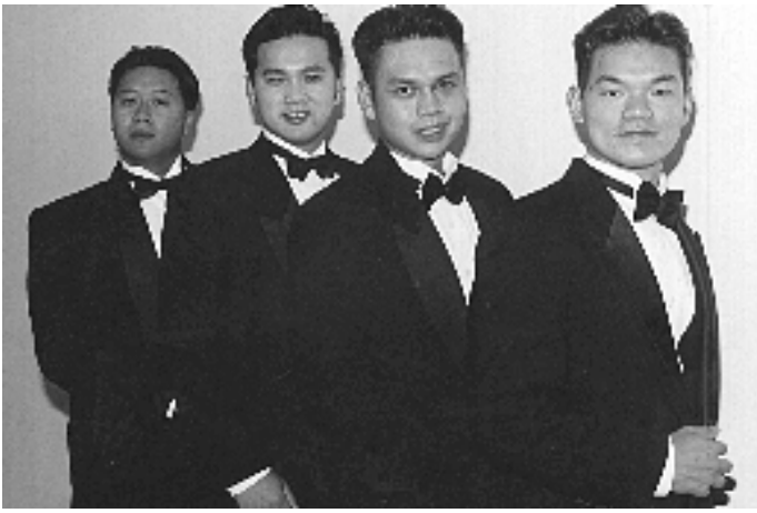
Bốn chàng Ngự Lâm "Escorts"...