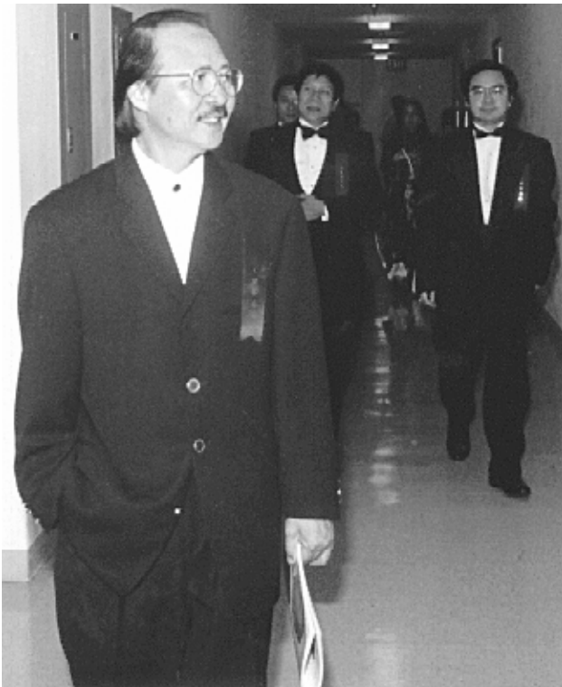
Ban giám khảo cuộc thi