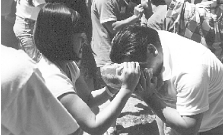
Cạp... cạp... cạp... coi chừng mắc nghẹn !!!

“Vòng tròn có một cái tâm, Cái tâm ở giữa vòng tròn, Đi sao cho đều cho khéo Để vòng tròn đừng méo đừng vuông...”