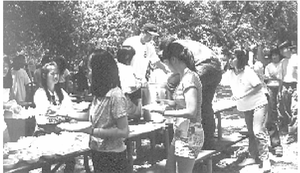
Giờ cơm đến rồi, giờ cơm đến rồi, mời ra soi, mời ra soi...

quen nhau... Một số bạn trẻ high school mau chóng kết thân với các anh chị sinh viên, có cả những em bé đi theo phụ