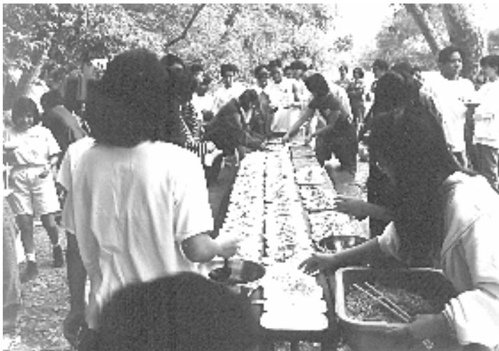
Lại tới giờ ăn nữa rồi, kỳ này phải xếp hàng trật tự đó nghe!