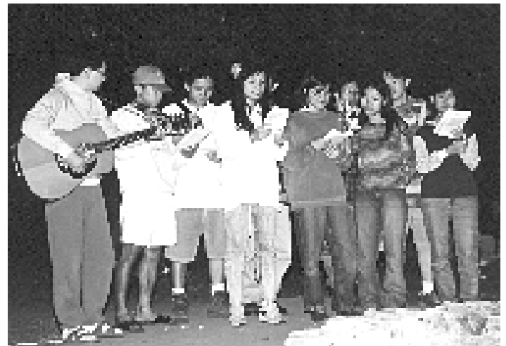
Đàn đồng ca thành lập tốc hành ngay trong đêm lửa trại