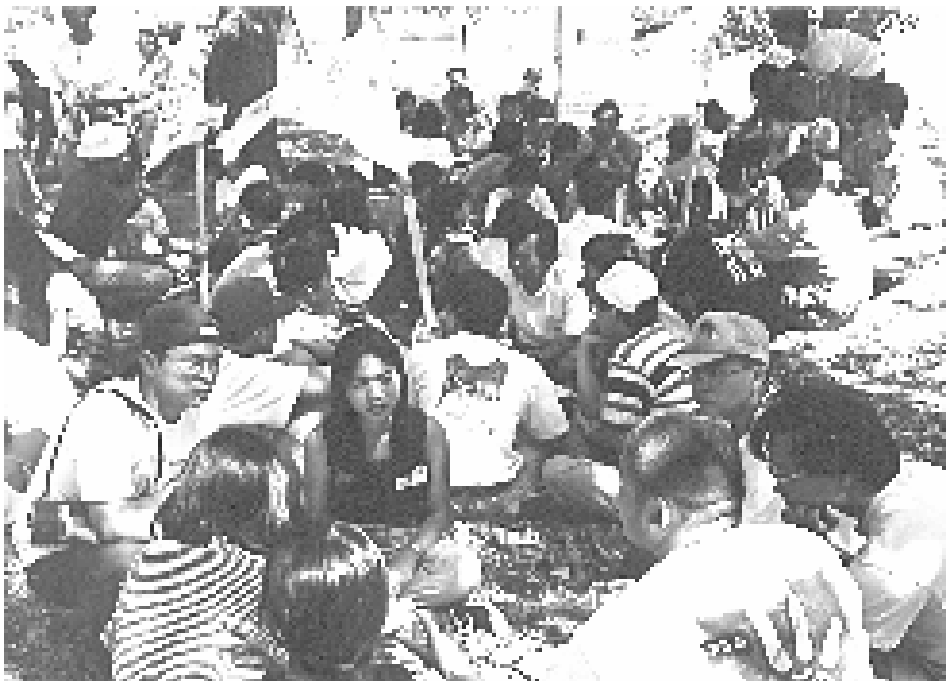
Hội thảo sôi nổi, hào hứng và thật ý nghĩa