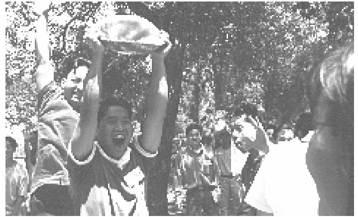
Niềm vui chiến thắng...