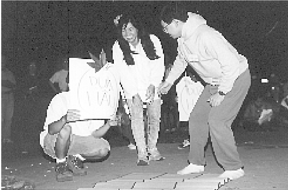
Tiết mục đoạt giải I đêm lửa trại, “An Tiêm và sự tích quả dưa hấu”

Đêm lửa trại, bao giờ cũng là phần sinh hoạt quan trọng, kỳ thú nhất của trại hè. Chúng tôi nóng lòng chờ đợi được chứng kiến những tiết mục văn nghệ đặc