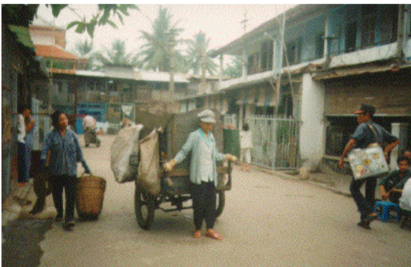
Tuổi Thơ Việt Nam: Em bé 14 tuổi phải đi lượm rác hàng ngày

Sau một lúc nói chuyện với cậu bé Tí tui được biết nhiều hơn về giới trẻ VN. Giới trẻ bây giờ đua nhau học ngoại ngữ, tin học và thương mại vì chỉ có những ngành này mới làm khá tiền. Học ngoại ngữ để làm thông dịch cho người nước ngoài, học tin học để làm cho các công ty ngoại quốc, học thương mại để hy vọng ra làm cho các công ty Đài loan v.v.... Ai cũng mong làm cho một công