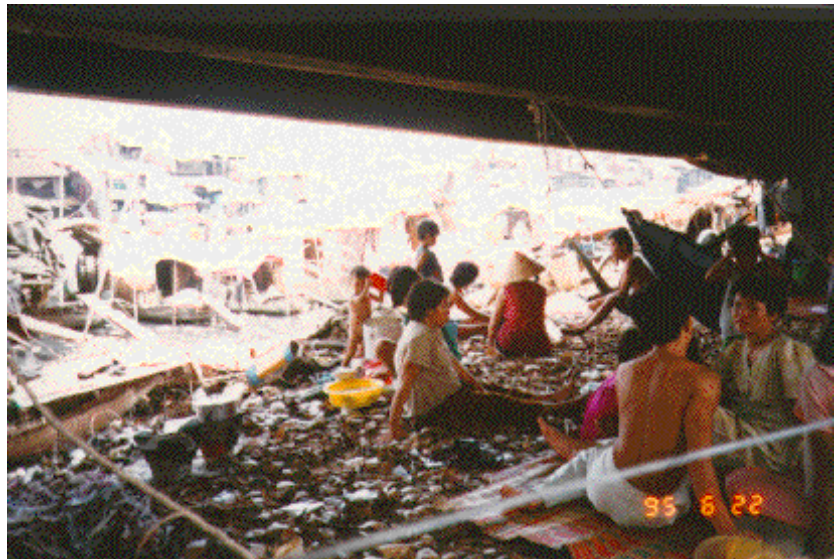
Những gia đình dưới gầm Cầu Ông Lãnh

Nhiều nơi tại VN đã được xây cất, sửa chữa lại khá đẹp để hấp dẫn khách du lịch nhưng cũng có những nơi đáng được trùng sửa lại cho đàng hoàng thì lại bị sửa qua loa như các đền đài thắng cảnh lại Huế v.v... mặc dù tiền của khách du lịch đổ vào khá nhiều. Tại Qui Nhơn, Tí tui có đến thăm mộ thi sĩ Hàn Mặc Tử và